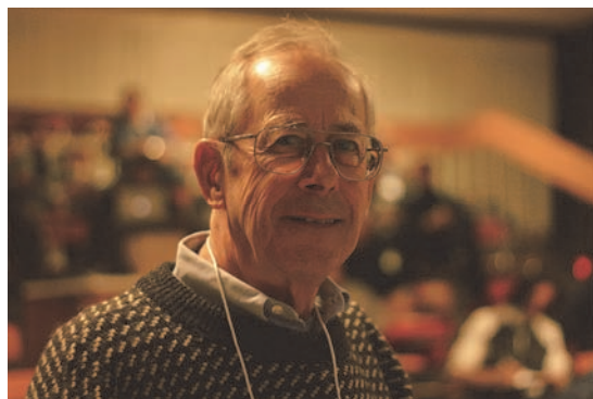
图1 James Peebles 的照片.

1948年, 核物理学家 Gamow 通过研究宇宙中的化学元素丰度, 提出宇宙起源于一个高温、高密度的“原始火球”, 随着宇宙的膨胀, 经历了由密到稀、由热到冷的演化史. 这一模型被称为“宇宙大爆炸模型”. 值得注意的是, 这里的爆炸跟鞭炮的爆炸有着非常大的区别. 鞭炮的爆炸