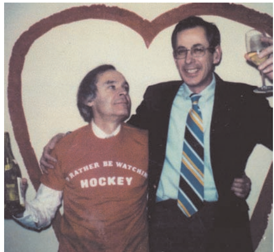
图 3 (网络版彩色)Wilkinson(左)和 Peebles(右).

与前面所说的全天均匀且各向同性的黑体谱信号不同, 微波背景各向异性信号刻画天空中两个不同方向处发出的微波背景辐射温度的差异. 这个信号极其之小, 大约