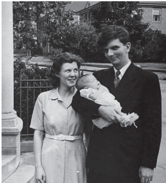
图 2 Dicke 一家.

一位在 MIT(Massachusetts Institute of Technology)的朋友得知此事后, 跟 Penzias 打了一通电话, 并给后者送来一份 Peebles 的尚未发表的预言微波背景辐射的文章.(Gamow 早在 1953 年就预言了宇宙微波背景辐射的存在, 当时的